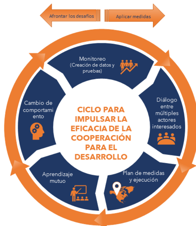
Figura 1: Ciclo para impulsar la eficacia de la cooperación para el desarrollo

Un Diálogo de Acción 2021 puede ayudar a los gobiernos de los países socios y a sus asociados a elaborar una idea común de los obstáculos y las prioridades para aumentar el uso eficiente y eficaz de la cooperación para el desarrollo y fomentar alianzas más sólidas en el contexto de desarrollo actual. Puede fortalecer los procesos de coordinación actuales, sobre todo cuando representan una parte fundamental de los esfuerzos de desarrollo, y promover los esfuerzos colectivos en el sentido del « enfoque de desarrollo que abarque a toda la sociedad » necesario para lograr los ODS, basándose en los resultados del ejercicio de monitoreo (si están disponibles).