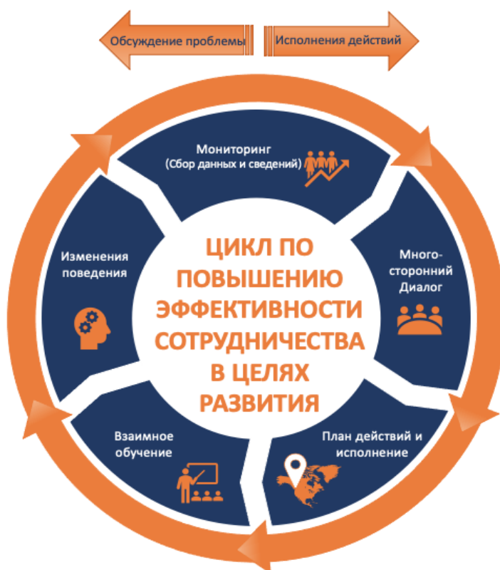
Рисунок 1. Цикл по повышению эффективности сотрудничества в целях развития

В долгосрочной перспективе, результаты от Диалогов Действий предназначены для продвижения политики, системы и поведенческих изменений, как неотъемлемая часть цикла по повышению эффективности сотрудничества в целях развития (см. рисунок 1).