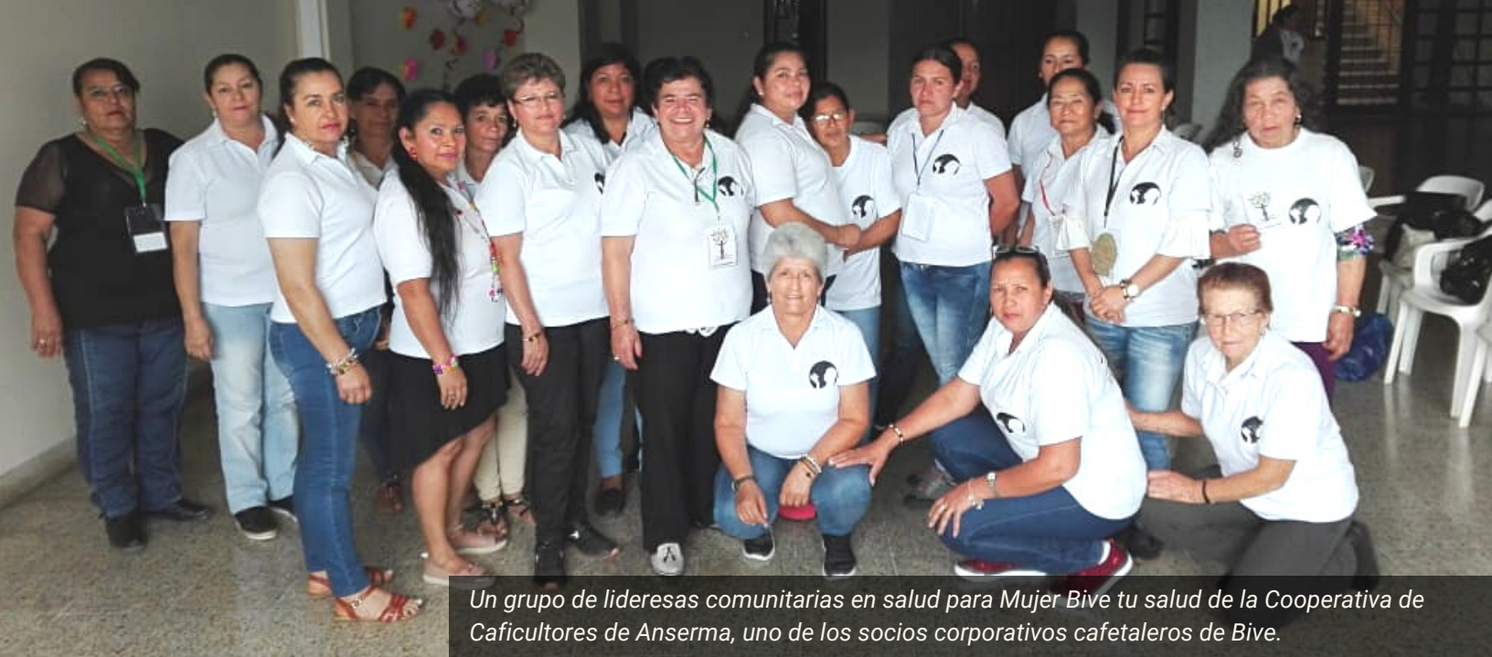
Un grupo de líderes comunitarias en salud para Mujer Bive tu salud de la Cooperativa de Caficultores de Anserma, uno de los socios corporativos cafetaleros de Bive.

En cooperación con los hospitales públicos, Bive identificó y conectó a pacientes con médicos que brindan servicios médicos cubiertos por el sistema de salud colombiano. El objetivo general de Bive es complementar los esfuerzos del Gobierno para reducir las enfermedades prevenibles y proporcionar mejores resultados de salud para las personas menos afortunadas de la sociedad, reduciendo así la pobreza multidimensional. 17 En los casos en que los usuarios de Bive tuvieron dificultades para ejercer su derecho de acceso a la salud, podían beneficiarse de los consejos de la orientación social que brinda Bive. Los pacientes podían recibir asesoramiento profesional, cortesía de abogados pro bono, sobre los procesos de presentación de derechos de petición o tutelas, por ejemplo. Bive también trabajó con la Defensoría del Pueblo en varios municipios.