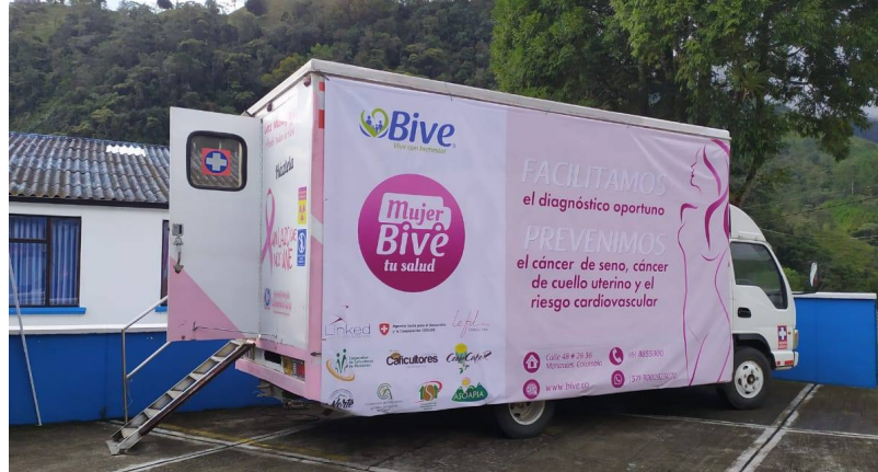
Las unidades móviles de Bive ofrecen servicios de salud a los lugares más aislados de las comunidades rurales.

A través de MBS, las mujeres reciben un examen médico general gratuito, examen del virus de papiloma humano (VPH), examen clínico de mama, Papanicolau y una evaluación de riesgo cardiovascular. 27 Después de este chequeo, se las conecta con especialistas por medio de la telemedicina. Los especialistas interpretan los resultados de sus pruebas y brindan un diagnóstico. 28 Las pacientes con resultados anormales en las pruebas reciben atención de seguimiento por teléfono 29 y son derivados a especialistas dentro de la red de prestadores de Bive. El proceso lleva unos 10 días en total, 30 sustancialmente más cortos que los tiempos de espera que pueden enfrentar dentro del sistema público de atención médica.