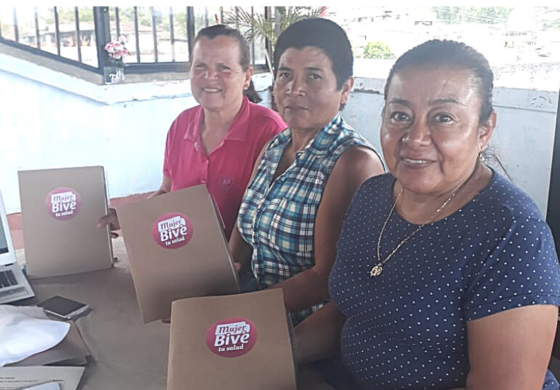
·Algunas de las mujeres lideresas que participaron en Mujer Bive tu Salud durante una reunión en febrero de 2020. Estas mujeres también hacen parte de las Cooperativas de Caficultores de los departamentos de Risaralda y Caldas.

Al mejorar la salud de aquellos colombianos que viven en zonas rurales, los pacientes atendidos con Bive se han enfermado menos y han podido seguir trabajando y llevar un ingreso a sus familias. 37 De esta manera MBS ha contribuido a aliviar la carga del sistema colombiano de salud y la prevención de condiciones de salud y la muerte prematura. 38